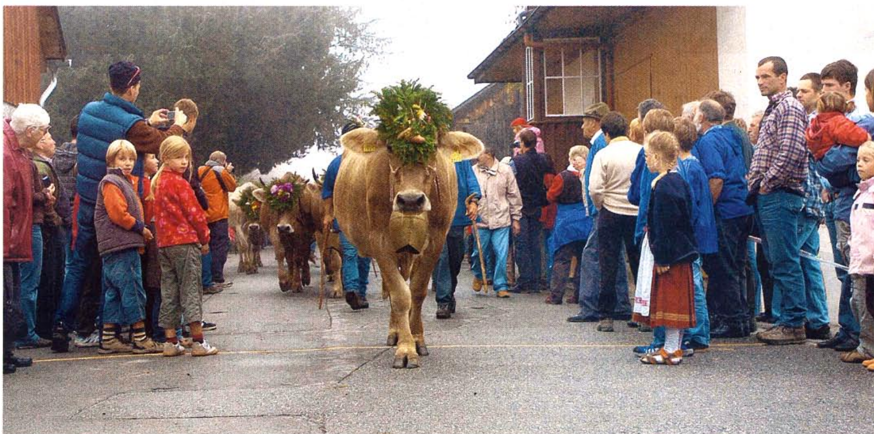
Grosser Empfang: Die Parade der mit «Tschäppeln» geschmückten Kühe zieht die Blicke aller Zuschauer auf sich.

Dann ist es so weit. Fast gespenstisch treten die Tiere aus dem Nebel. Allen voran zwei Dutzend Ziegen, die erhobenen Hauptes voranzustolzen. Über 100 Kühe folgen, geschmückt mit wunderschönen «Tschäppeln» aus Tannenkreis und Blumen, die ihnen die Bauern und Bäuerinnen auf Haupt und Rücken gebunden haben. Als Schlusslicht folgt der Alpnutzen – also das mit dem Alpkäse beladene Pferdegespann, das von einer lüpfigen Ländlermusik begleitet wird. Hunderte, ja Tausende Zuschauer verfolgen das Spektakel. Auch wenn der Alpbzug nur fingiert ist – die Alpen werden normalerweise bereits im September entladen –, tut dies der Freude keinen Abbruch.