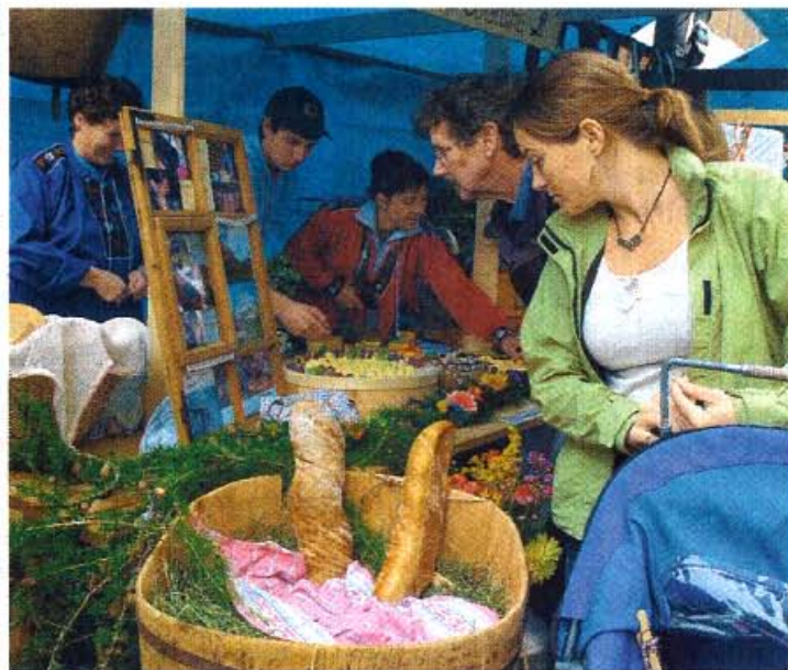
Hören, probieren, stöbern: Zwischen Volksmusik, Alpkäseprämierung und buntem Markttreiben – das Prättigauer Alp Spektakel bietet für jeden Geschmack etwas.